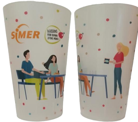
➔ Gobelets 30/40 CL