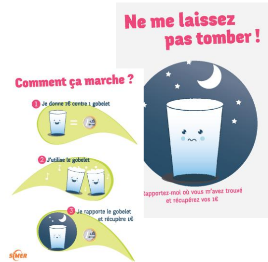
➔ Affiches Lots d'affiches pour expliquer le fonctionnement

Le prêt de gobelets est gratuit, une facturation est effectuée à partir du premier gobelet manquant. Conformément à la convention de prêt qui sera signée, vous vous engagez à mettre en place une consigne.