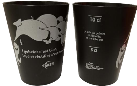
➔ Gobelets 10 CL Idéal pour les boissons chaudes (café/thé)