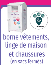
borne vêtements, linge de maison et chaussures (en sacs fermés)